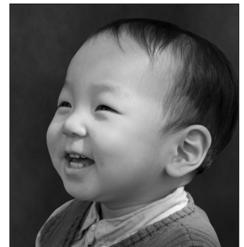
".....이는 내 능력이 약한 데서 온전하여짐이라....."

8. 외모의 차이를 통해 우리 안에 하나님의 ( _____ )를 닮아 돌보이게 하신다. 고린도후서 12:9